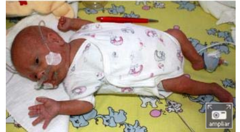
Imágenes cedidas por la Universidad Médica de Gotinga en las que puede verse al bebé en junio de 2009 (arriba) y en octubre de ese mismo año (abajo). - EFE