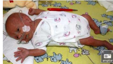
Imágenes cedidas por la Universidad Médica de Gotinga en las que puede verse al bebé en junio de 2009 (arriba) y en octubre de ese mismo año (abajo). - EFE